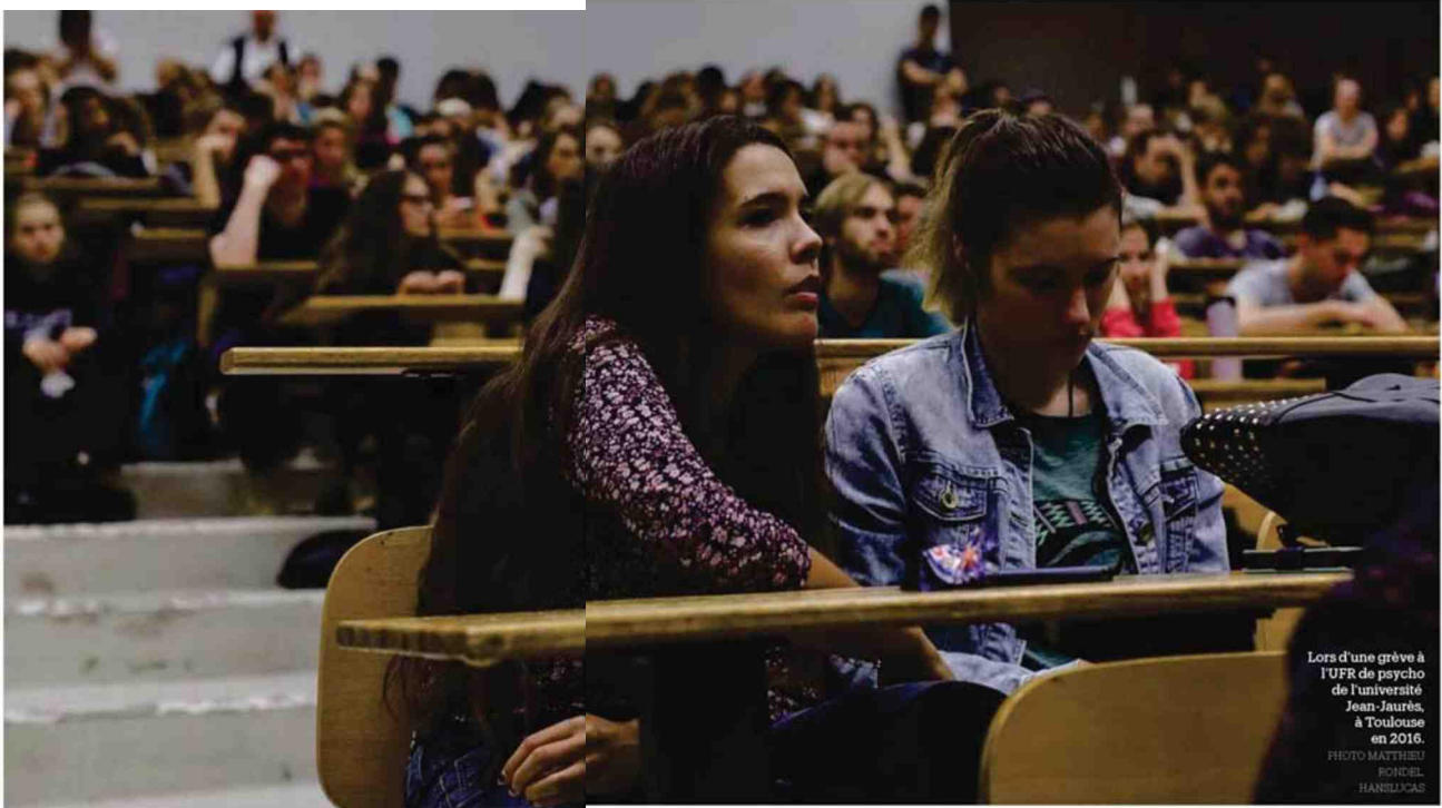
Lors d'une grève à l'UFR de psycho de l'université Jean-Jaurès, à Toulouse en 2016.