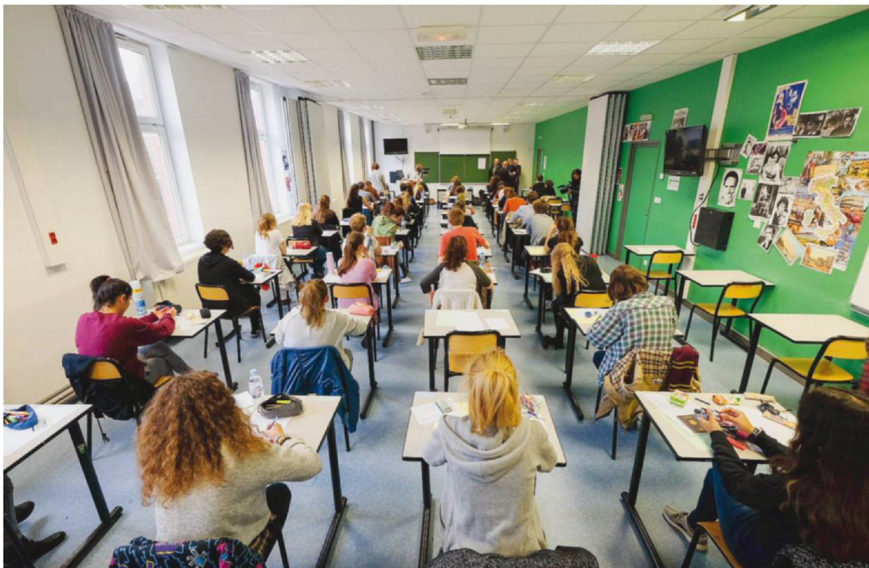
En juin 2016, à Lille, des élèves passent l'épreuve de philosophie du bac.