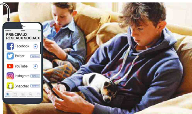
Pour l'immense majorité des jeunes, le réseau n'est qu'un prolongement des échanges sociaux.