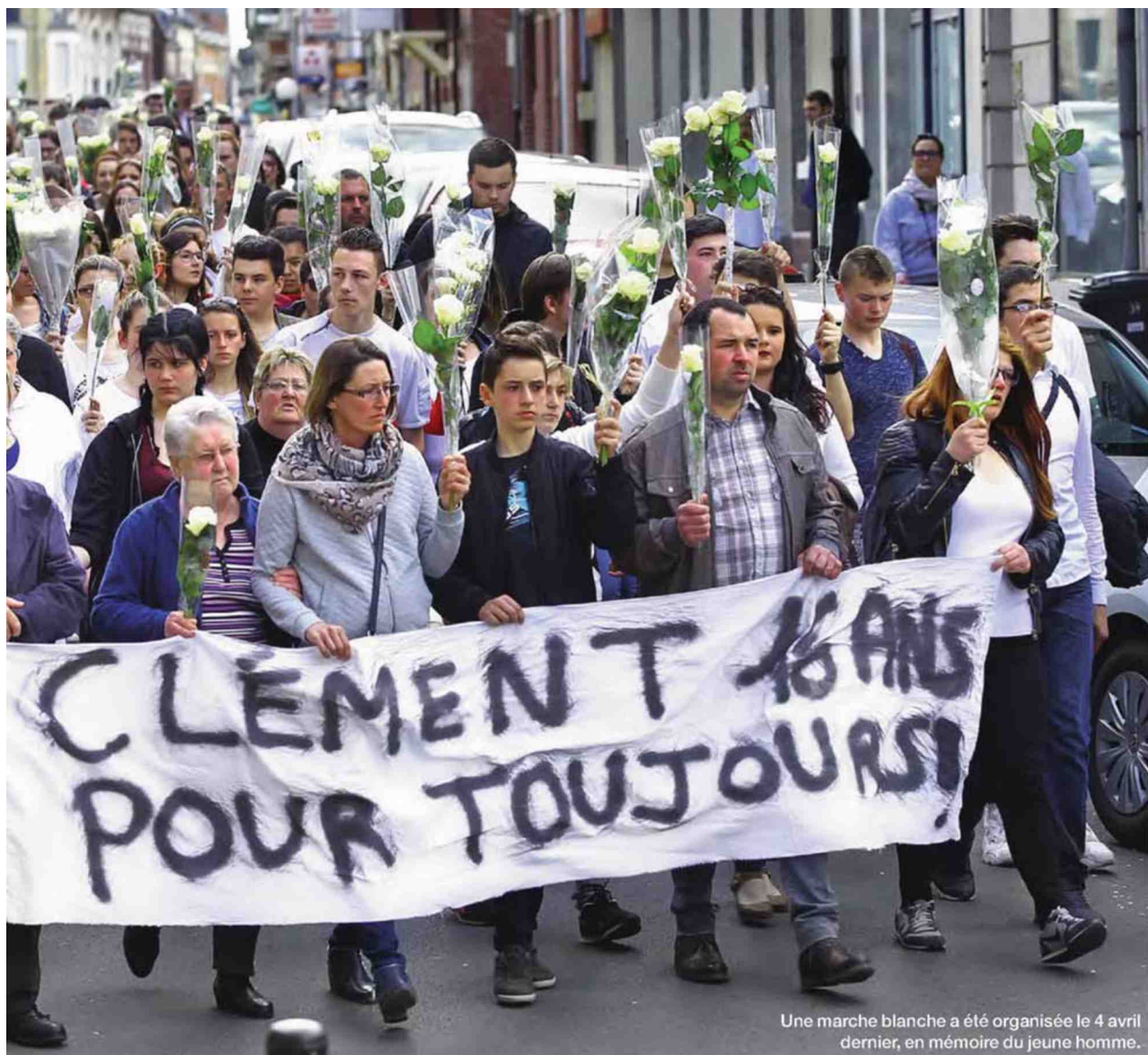
Une marche blanche a été organisée le 4 avril dernier, en mémoire du jeune homme.