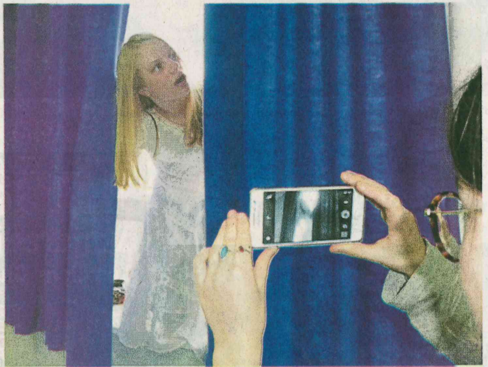
Le film de Billy Wilder revisité. Un vrai travail de création.