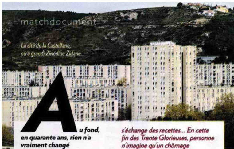
La cité de la Castellane, où a grandi Zinedine Zidane.

A u fond, en quarante ans, rien n'a vraiment changé à Marseille, où je suis née.