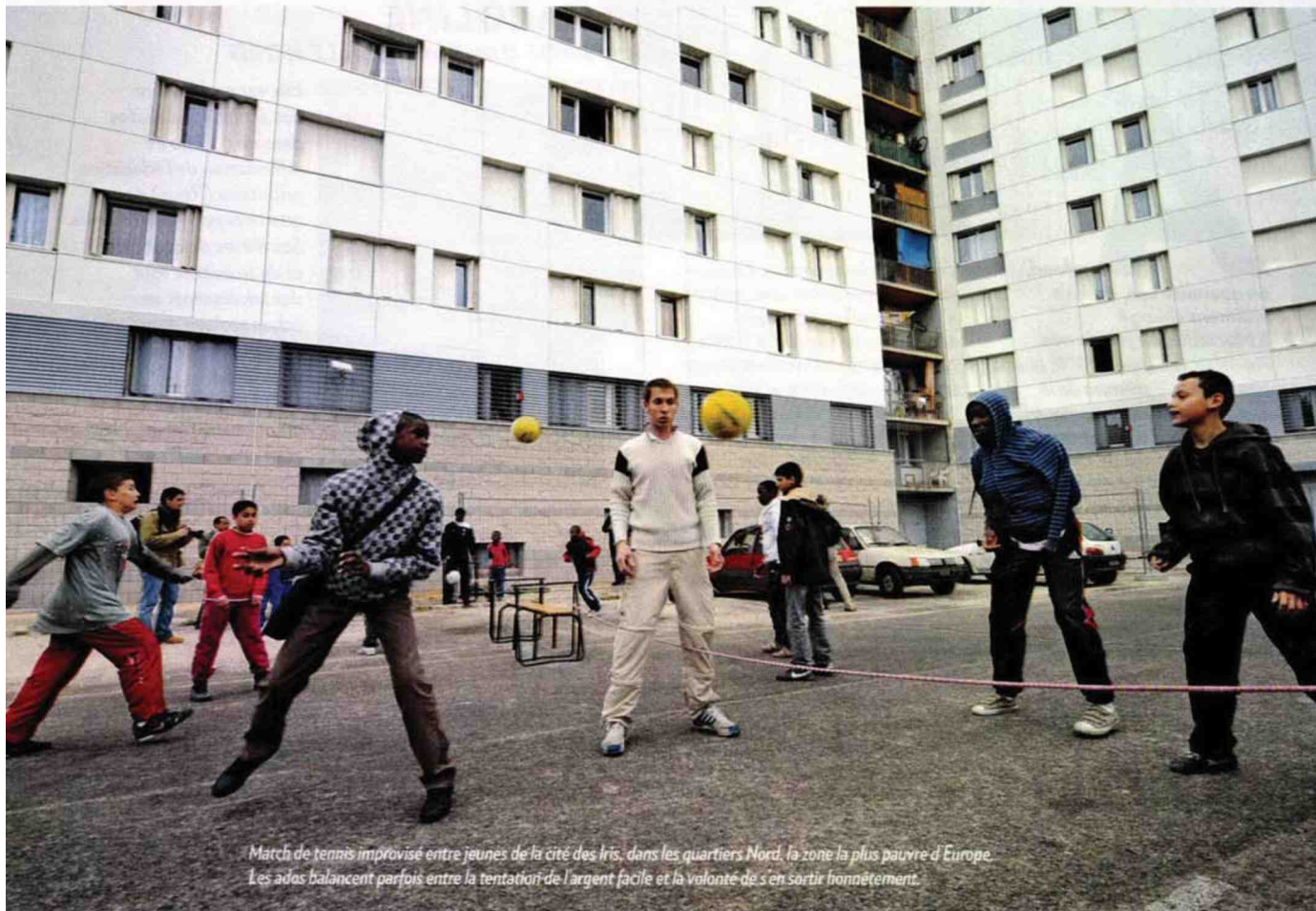
Match de tennis improvisé entre jeunes de la cité des Iris, dans les quartiers Nord, la zone la plus pauvre d'Europe. Les ados balancent parfois entre la tentation de l'argent facile et la volonté de s'en sortir honnêtement.