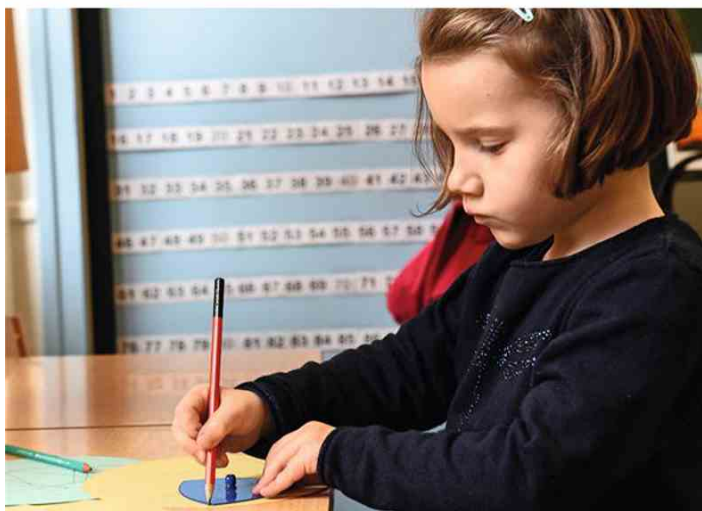
Tracer des contours avec les « formes à dessin ».