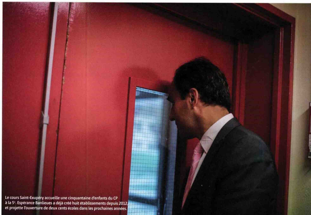
Le cours Saint-Exupéry accueille une cinquantaine d'enfants du CP à la 5 e . Espérance Banlieues a déjà créé huit établissements depuis 2012 et projette l'ouverture de deux cents écoles dans les prochaines années.