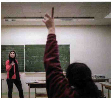
À l'origine d'Espérance Banlieues, la Fondation pour l'école abrite tout un ensemble de filiales dans le secteur éducatif, de la formation des maîtres à l'enseignement dans les cités.

L'homme quitte effectivement la politique, mais pas ses réseaux catholiques traditionalistes. En 2007, il s'allie avec une autre