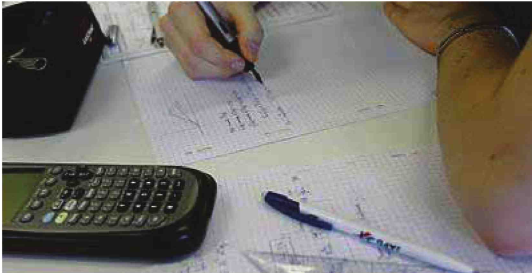
Certains étudiants n'ont pas pu accéder à la troisième année de licence après avoir fait deux ans de classes préparatoires.

refuser un accès en troisième année de licence après avoir fait deux ans de classe préparatoire « alors qu'avant, ils auraient été admis à l'université ». Ce n'est pas le cas partout. Pascal Charpentier, de l'Association des proviseurs de lycées à classes préparatoires aux grandes écoles (APLCPGE) parle d'ailleurs « de grandes disparités nationales [comme] d'un vrai problème ».