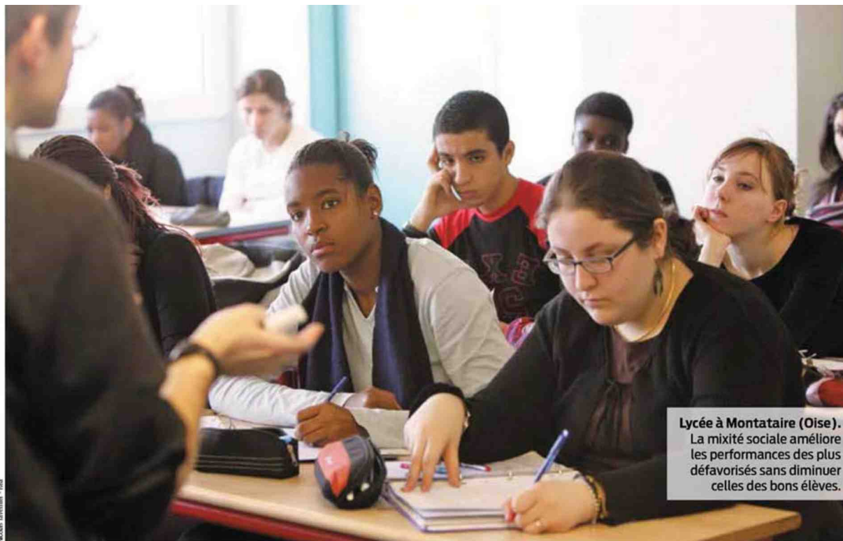
Lycée à Montataire (Oise). La mixité sociale améliore les performances des plus défavorisés sans diminuer celles des bons élèves.

d'une réduction de la taille des classes à ces niveaux a pourtant été démontré.