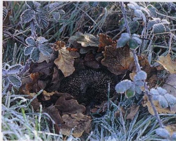
b Un hibernant : le hérisson.

Le hérisson est un mammifère très actif pendant la belle saison : il consomme des insectes, des vers, des mollusques... C'est aussi à cette saison qu'il se reproduit. Au début de l'automne, il prépare un abri bien protégé garni d'une couche de feuilles ou d'herbes sèches puis s'endort d'un profond sommeil jusqu'à la fin de l'hiver. Pendant cette hibernation, il utilise les réserves de graisse accumulées au cours de l'été.