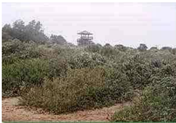
« La Pointe du Siège » Ouistreham Le reportage a été enregistré au pied de cet observatoire